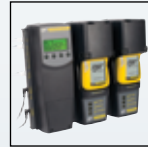
Совместимость с MicroDock II