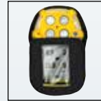
Чехол для переноски